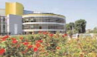
Nuovo Ospedale Civile di Sassuolo